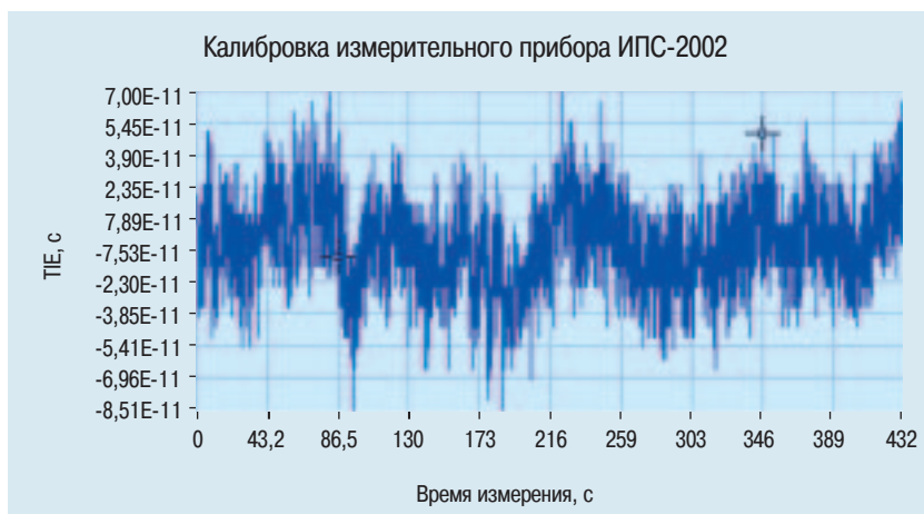
Уровень внутреннего фазового шума прибора измерен с интервалом выборки 0,03 секунды

Что же касается стандартов частоты на основе спутниковых радио-